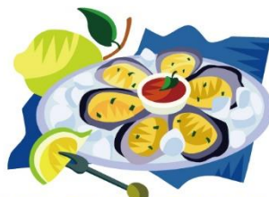
牡蠣には亜鉛が多く含まれています

免疫力を高めるには、ミネラルも大切です。魚や海草に含まれる有機ミネラルは、身体に優しく、また肌の健康美を保つ作用もあります。中でも魚介類に多く含まれる亜鉛、セレンウム、クロニウムは新陳代謝を活発にするミネラルであり、不足すると免疫細胞の低下につながります。